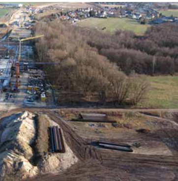
10 Doppelkammerschleuse, Kachlet, Foto: WSA Regensburg