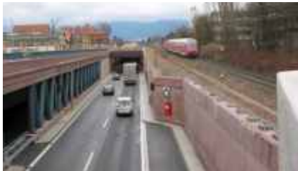
Blick auf West-Portal Kappler Tunnel mit Lärmschutzgalerie Ost