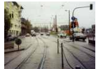
Haltestelle Bürgerwehrstraße, Blick auf Schwarzwaldstraße

- Genehmigungsplanung (Standortsicherheitsnachweise gemäß ZTV-K) - Ausführungsplanung (gemäß ZTV-K) - Planung der Verkehrsführung während der Bauzeit - Herstellung der Bestandsunterlagen - Mitwirkung bei den Abstimmungen mit den Verkehrsträgern und Trägern öffentlicher Belange