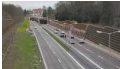
Lärmschutzgalerie West mit Blick auf Ost-Portal Schützenallee tunnel

Aufgrund der sehr starken Verkehrsbelastung der B 31 erteilte das Regierungspräsidium Freiburg 1997 der ARGE B 31-Ost den Auftrag, die Verkehrsabwicklung an der Anschlussstelle Schwarzwaldstraße so durchzuführen, dass es durch die Baumaßnahme zu keinen nennenswerten Behinderungen kommt.