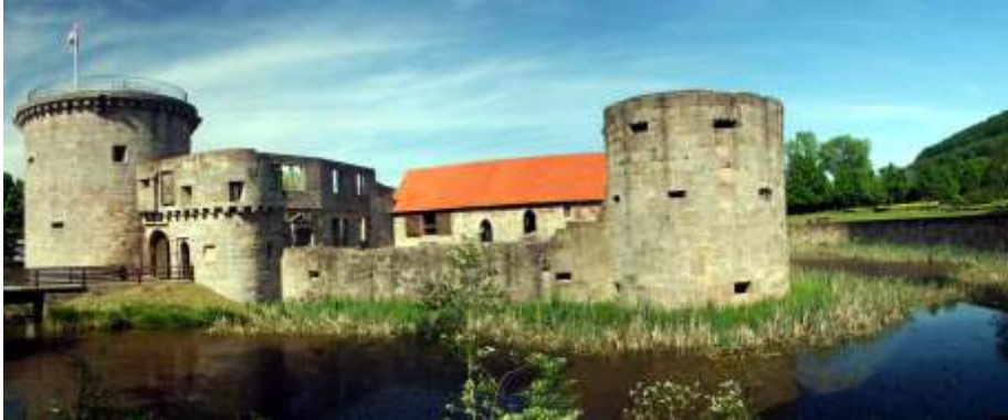
Ansicht der Wasserburgruine Friedewald

Die Burg, die den hessischen Grafen als Jagdschloss und Verwaltungssitz diente, wurde gegen 1480 als Festungsbau mit vier Wehrtürmen errichtet und nach der Belagerung durch die Franzosen 1762 teilweise zerstört.